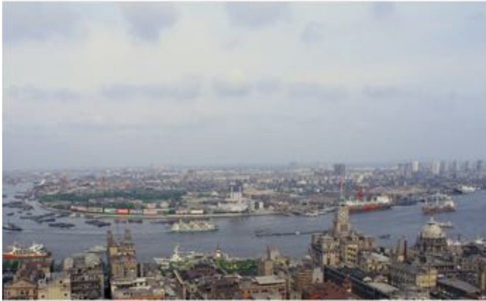
Shanghai Pudong en 1987